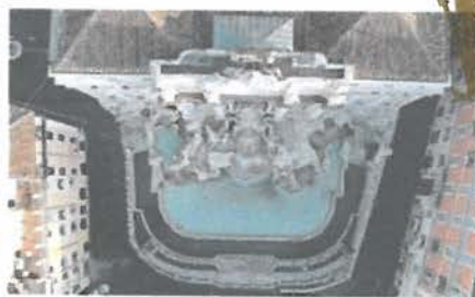
Fontana di Trevi vista dal drone nel corto "Er Collera Moribbus"